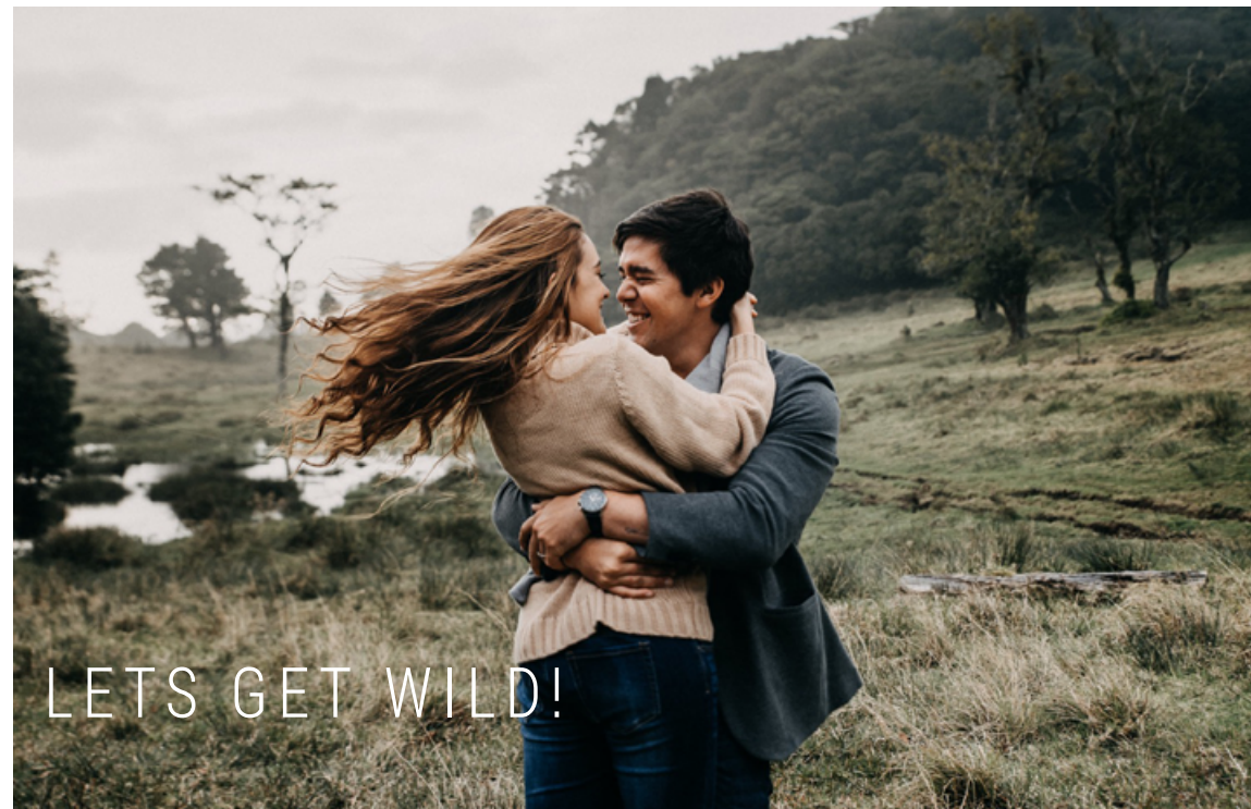
MONTE DE LA CRUZ