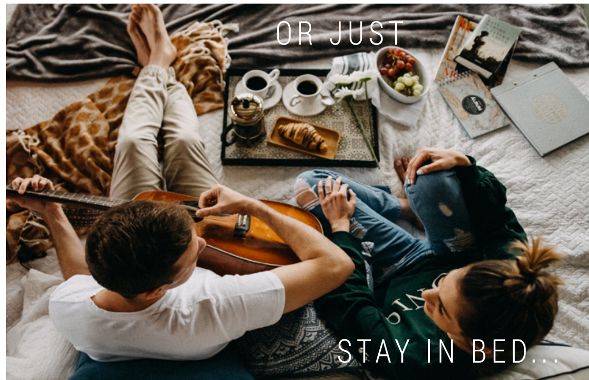
CABAÑA EN CARTAGO