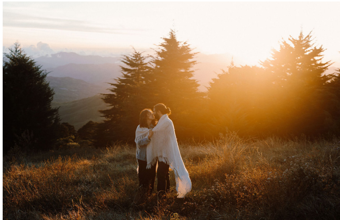
GABY & JOE / CERROS DE ESCAZÚ